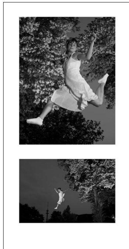
© Boris Steinert & Arne Hagen

Die Arbeit ist im Rahmen eines Projekts zum Thema »Grenzen überwinden« entstanden. »Welche Grenze regte die Träume Menschen schon seit Anbeginn der Zeit besonders an? Diese Frage hat uns von Anfang an beschäftigt und sehr schnell zu einer eindeutigen Antwort geführt: »die Grenze der Schwerkraft. So war es unser Ziel, Bilder zu schaffen, die eine illusionäre Überwindung der Schwerkraft zeigen. Wir haben immer zwei Bilder gegeneinan-