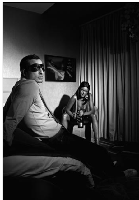
© Ajdin Pajevic & Nicola Tauscher

Nicola Tauscher und Ajdin Pajevic verwenden in ihren Arbeiten Stereotypen aus der Partywelt, die ihnen als Projektionsflächen für Abenteuerlust und verspielte Kindlichkeit dienen. Die gewollt künstlichen Situationen sind Zeugnisse einer artifiziiellen Scheinwelt, in der alles möglich erscheint, so lange der Abend noch jung ist. Sie sichern den Protagonisten eine Anonymität, hinter der sie sich verstecken und eine andere Rolle annehmen können. Dasselbe gilt für die Fotos aus der Dont disturb-Serie, in denen sich zwei Unbekannte in einem Hotelzimmer wiederfinden. Auch hier wird der Raum zum Synonym für eine unwirkliche Traumwelt, Platz für Illusionen schafft.