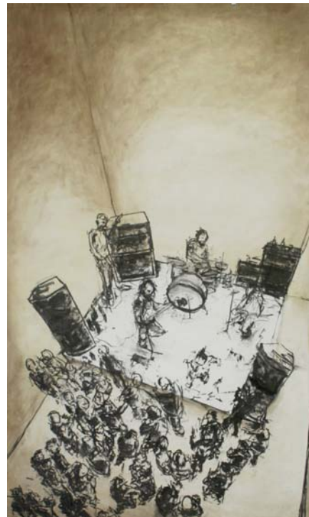
Konzert [Bewegung (Innenraum # 1)]