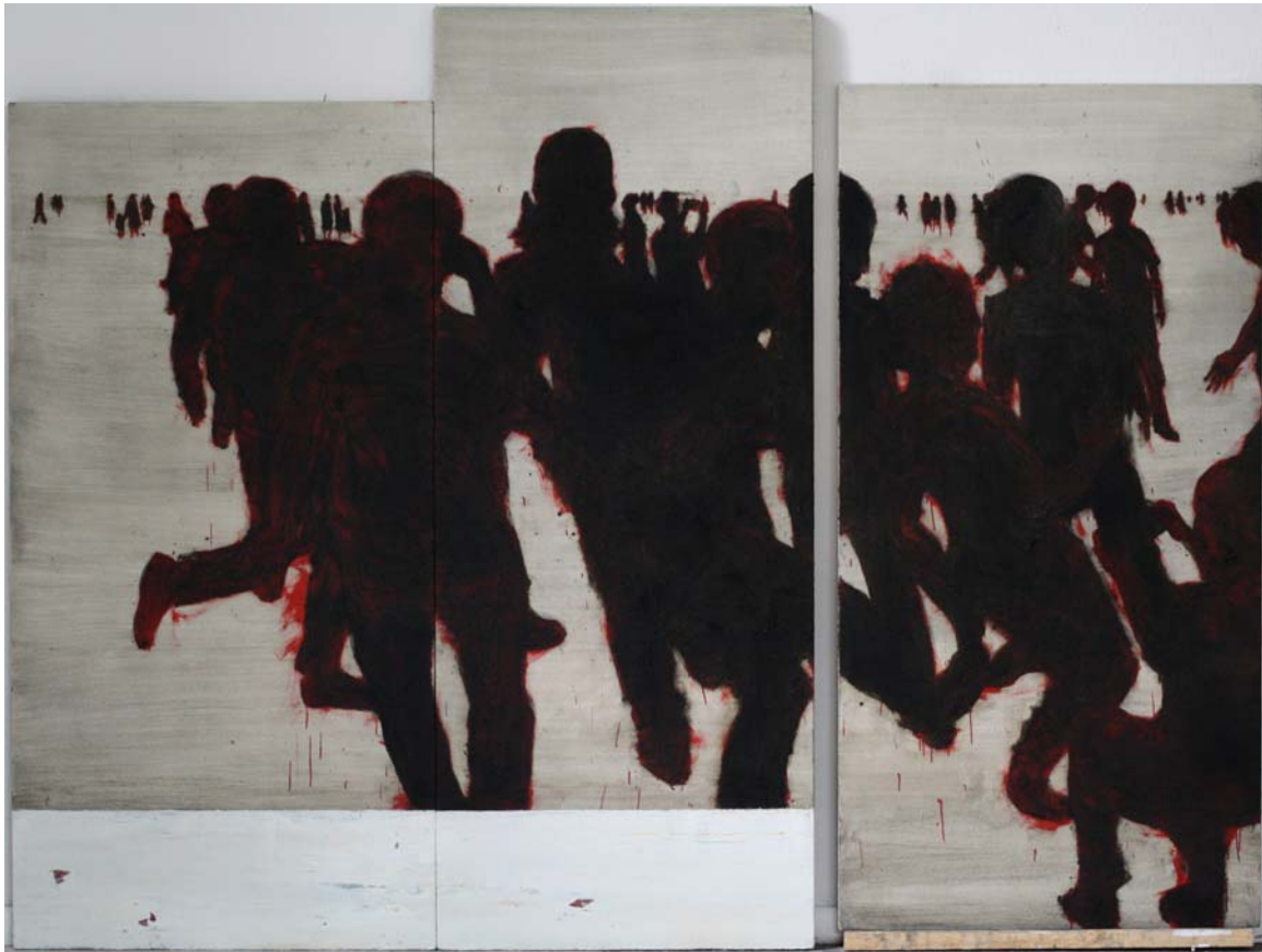
Untitled 2009, Oil and dirt of the streets on canvas, 3teilig, je 78,7 x 39,4 inches, je 200 x 100 cm